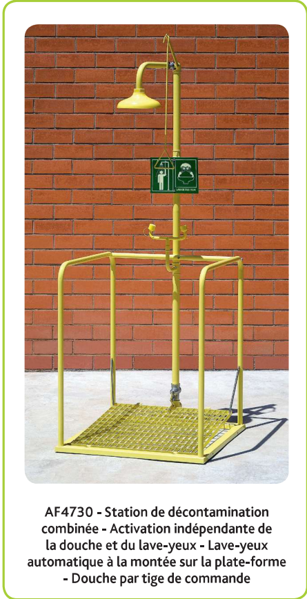
AF4730 - Station de décontamination combinée - Activation indépendante de la douche et du lave-yeux - Lave-yeux automatique à la montée sur la plate-forme - Douche par tige de commande