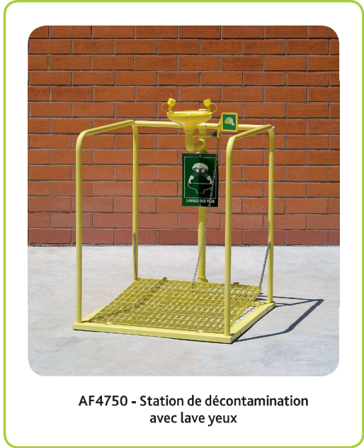
AF4750 - Station de décontamination avec lave yeux

D'autres modèles existent : n'hésitez pas à nous consulter pour une étude personnalisée !