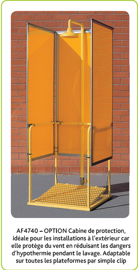
AF4740 – OPTION Cabine de protection, idéale pour les installations à l'extérieur car elle protège du vent en réduisant les dangers d'hypothermie pendant le lavage. Adaptable sur toutes les plateformes par simple clip