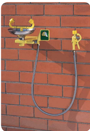
AF2230 SS – Lave-yeux mural avec douchette (flexible Inox 1m50 et support mural fournis)