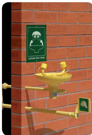
AF2210FP – Lave-yeux incongelable alimentation en traversée de mur