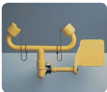
AF3510 - Lave-yeux mural sans vasque, commande manuelle