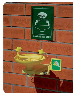
AF2210 – Lave-yeux mural avec vasque, par palette de commande manuelle